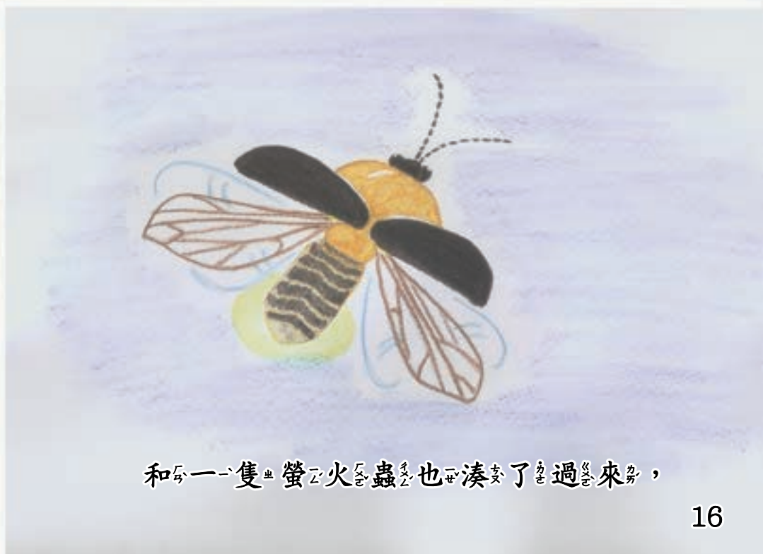
和一隻螢火蟲也湊湊了過來，