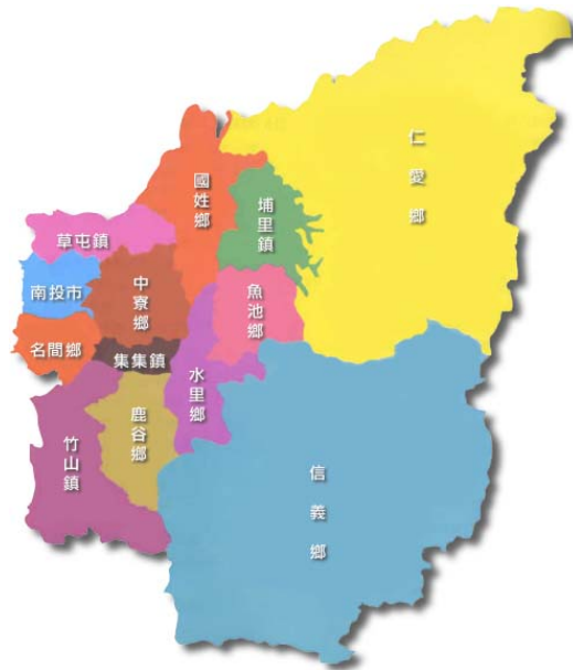
圖 2.1 南投縣行政區圖

本縣之地形以平原及山地為主體，其間則散布有丘陵、臺地、盆地及河谷等地形。平原以南投市為中心，另包括草屯、竹山與集集 3 鎮與名間鄉，其餘鄉鎮為山區。地勢大體由東向西降低，全境山地佔 83%，其坡度皆在 10% 以上。