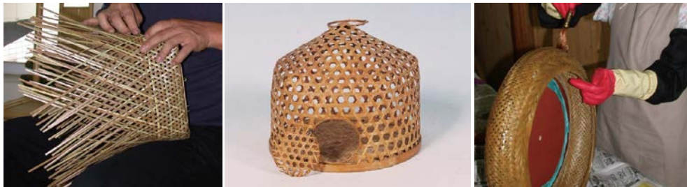
圖 2.8 南投竹藝文化

南投縣因擁有豐富的竹林資源，食衣住行育樂等生活日常用品，多以竹材為主要材質，日治時代位於南投縣東南之林圯埔大坪頂地區，因孟宗竹林相幽美、翠綠連綿，乃定名為竹山。民國 63 年於竹山延平地區設立竹材專業加工區，推動竹產業，民國 76 年，行政院文化建設委員會為落實文化資產保存、維護政策，委託規劃籌設竹藝博物館，館內除提供參觀導覽外；並提供學習單，供國中小教師作為教學教材使用。