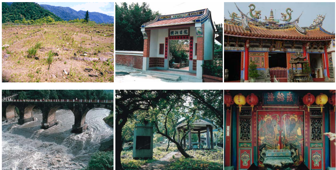
圖 2.5 南投文化資源巡禮

本縣文化資產豐富，有指定古蹟 15 處、登錄歷史建築 38 處、縣定遺址 3 處、文化景觀 1 處、15 項傳統藝術、4 項民俗及有關文物。每一處歷史建築、每一個社區，每一項傳統文物都述說著歲月流轉輪替、過往今來變遷的故事，詳加規劃必能提供民眾兼具知性與感性的文化饗宴。