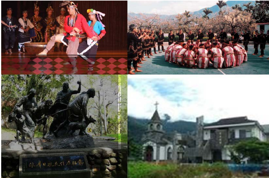
圖 2.6 南投縣各族原住民文化

發展特有的風貌；各族群的歷史介紹、分佈遷徙與服飾特色等，可顯示出不同的族群文化特質。