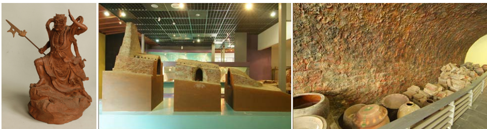
圖 2.7 南投陶藝文化

南投縣境內陸續有各類原住民陶片的文化遺址出土，可見陶與南投淵源之深；文獻可考的南投陶超過二百年歷史，與先民生活各層面息息相關。在日治時期陶業達到鼎盛，風光一時，發展至今已成為南投縣特殊產物之一，早期陶業發展需考量燃料及水之外，『土』更是關鍵，而南投縣國姓鄉及魚池鄉是臺灣少數陶土產地之一，可透過陶藝文化帶入了解南投縣的歷史、文化與地質景觀。