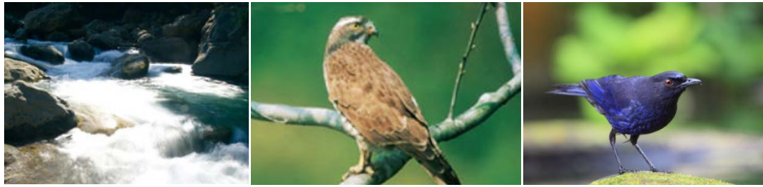
圖 2.4 參山國家風景區生態資源